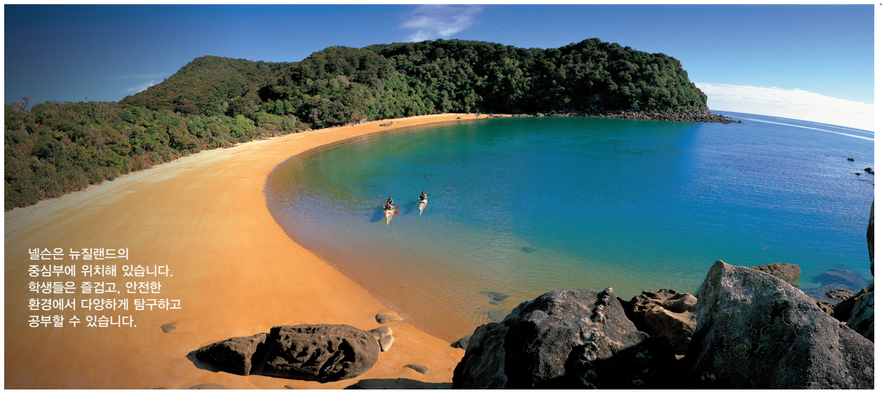
넬슨은 뉴질랜드의 중심부에 위치해 있습니다. 학생들은 즐겁고, 안전한 환경에서 다양하게 탐구하고 공부할 수 있습니다.